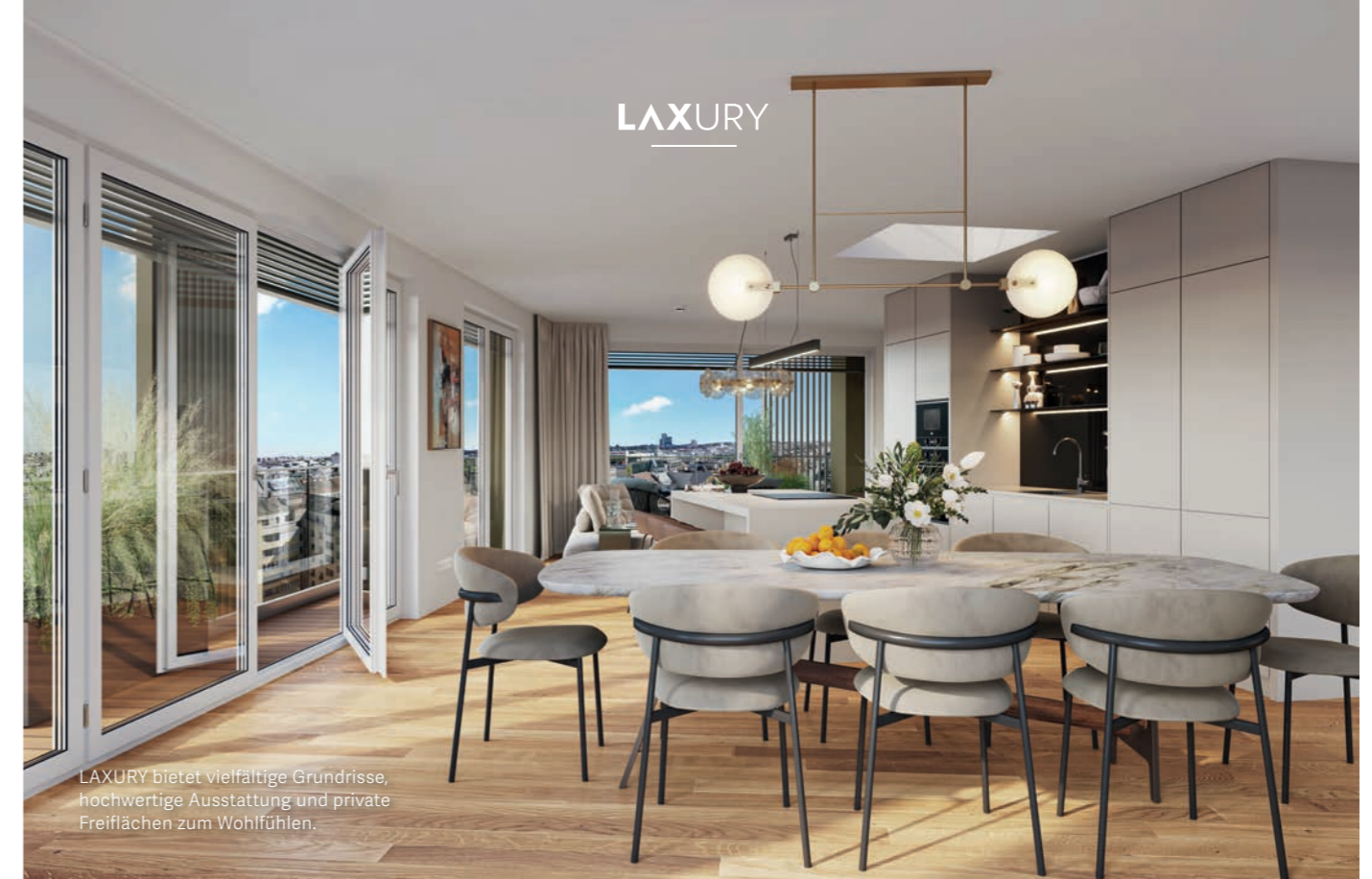
LAXURY bietet vielfältige Grundrisse, hochwertige Ausstattung und private Freiflächen zum Wohlfühlen.